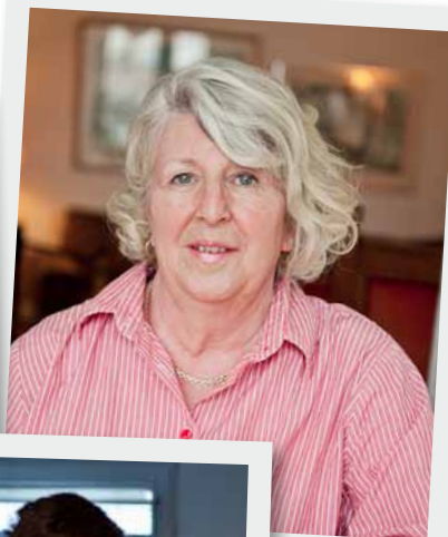
Seniorlägenhet på Gärdet