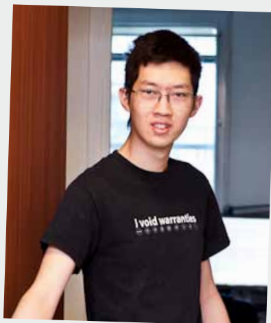
Ungdomslägenhet i Sättra