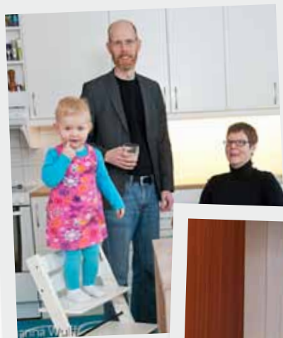
Nyproduktion i Sollentuna