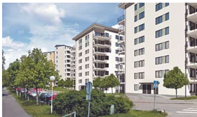
Klockarvägen i Huddinge Centrum

och en kostnadsfri förmedling av lägenheter. Bostadsförmedlingen visar intresse och är till exempel själva ute och besöker vår nyproduktion för att kunna informera kunderna om våra områden och lägenheter.