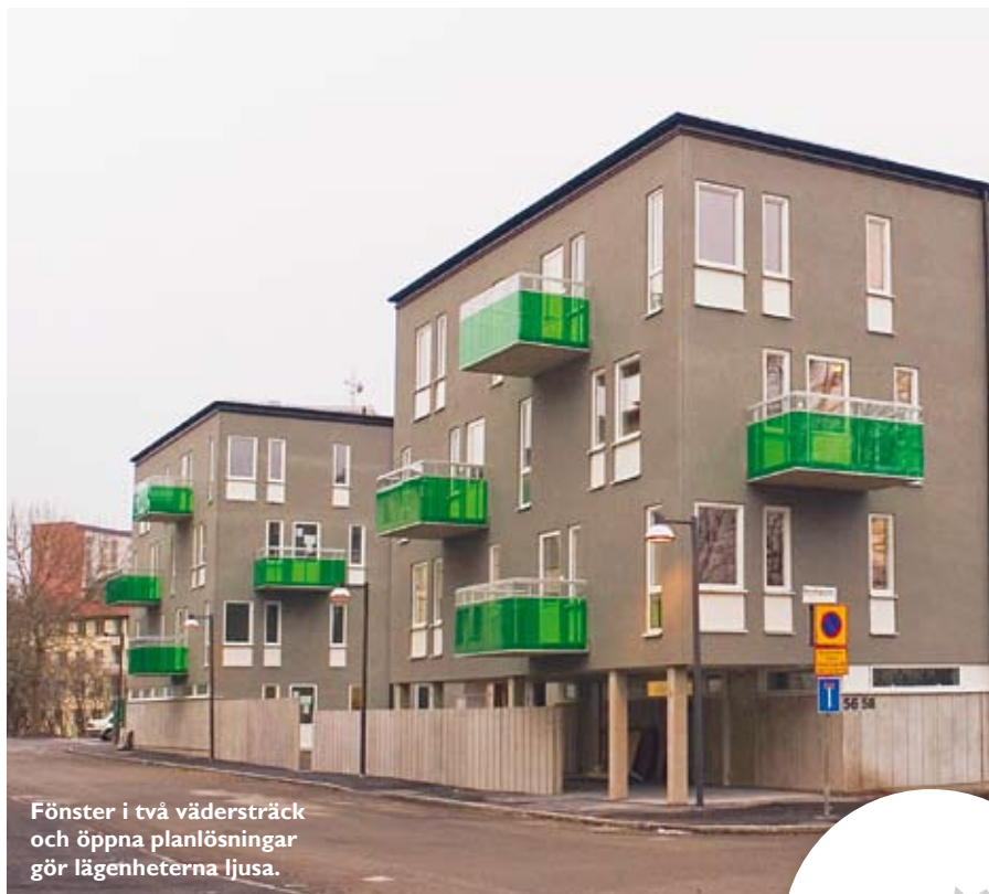
Fönster i två vädersträck och öppna planlösningar gör lägenheterna ljusa.

Intresset från bostadskön för de totalt 24 lägenheterna som erbjudits dem har varit stort, drygt 600 intresseanmälningar gjordes under de två veckor som lägenheterna annonserades. Medelkötiden landade på 2,1 år för alla lägenhetsstorlekar och hyrorna varierar mellan 5 720 kronor (1 rum och kök) och 8 750 kronor (3 rum och kök). De första inflyttningarna sker under februari och mars i år.